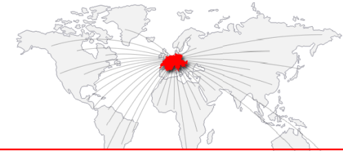
Dienstleistungspotential der Auslandshandelskammern